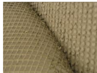
Obr. 47 – Zkouška zmýdelnatění

Na omítku se nanese určená lepicí hmota, nejčastěji na bázi cementu, v rozsahu cca 0,5 m x 0,5 m tloušťky 3 mm a zapracuje se do ní sklotextilní síťovina s přesahem. Po 7 dnech se provede odtržení sklotextilní síťoviny za volný konec jedním tahem. V případě, že po odtržení sklotextilní síťoviny lepicí hmota zůstane pevně na omítce (viz Obr. 47), pro lepení nové vrstvy ETICS lze použít lepicí hmota na cementové bázi. V případě, že dojde k oddělení lepidla od původní omítky, případně i s vrstvou původní omítky, je nutné použít lepicí hmotu na organické bázi – Baumit PowerFlex .