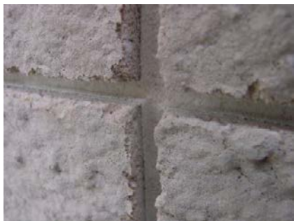
Obr. 48 – Vyfrézované drážky