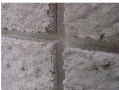
Obr. 47 – Vyfrézované drážky