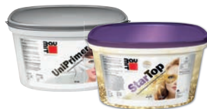
Baumit UniPrimer + Baumit StarTop / NanoporTop