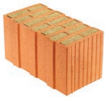
Porotherm T Profi Dryfix Porotherm T Profi