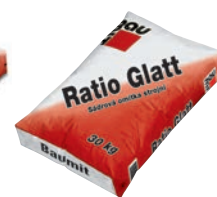
Baumit Ratio Glatt