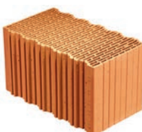
Porotherm EKO+ Profi Dryfix Porotherm EKO+ Profi