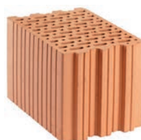
Porotherm AKU Profi Porotherm AKU*