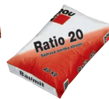
Baumit Ratio 20