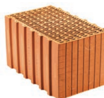
Porotherm (dříve P+D)