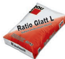
Baumit Ratio Glatt L