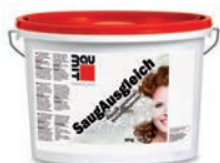
Baumit vyrovnávač nasákavosti