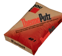
Baumit Thermo omítka