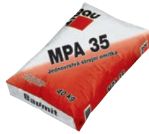
Baumit MPA 35