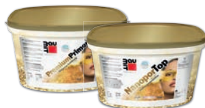
Baumit PremiumPrimer + Baumit NanoporTop / SilikonTop Zrnitost \geq 2 mm.