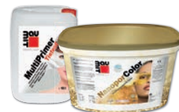
Baumit MultiPrimer + Baumit NanoporColor / StarColor / SilikonColor