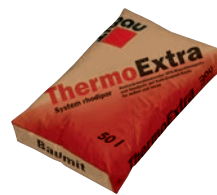
Baumit Thermo omítka Extra