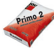
Baumit Primo 2 / Primo 1