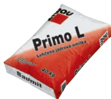
Baumit Primo L