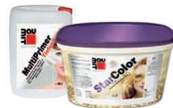
Baumit MultiPrimer + Baumit StarColor / NanoporColor / SilikonColor