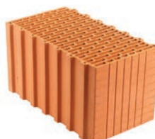
Porotherm (dříve P+D)