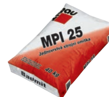
Baumit MPI 25