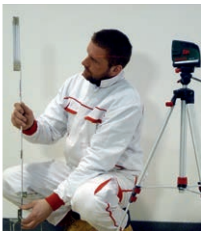
Zaměření nivelety a stanovení výšky podlahové konstrukce pomocí nivelačního laseru.