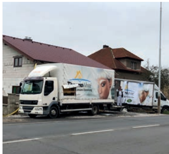
Před začátkem realizace podlahové vrstvy je EPS granulát smíchán s pojivem.