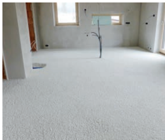
Po celoplošném vyrovnání a ztuhnutí je nutné směs nechat vyzrát minimálně 48 h (v závislosti na klimatických podmínkách).