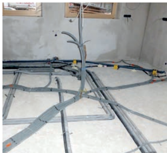
Připravený podklad před aplikací izolačního systému ThermoWhite. Jednou z výhod systému je absence jakéhokoliv prořezu.