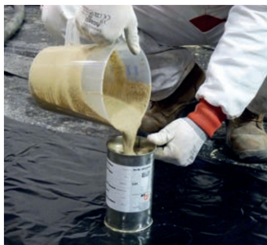
V případě nevytápěného potěru je nutné na podklad celoplošně rozprostřít Separální PE folii. Před zahájením lití směsi Baumit Alpha je nutné ověřit konzistenci směsi pomocí rozlívové zkoušky.