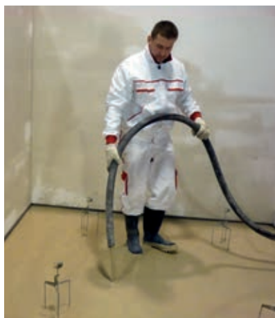
Lití samonivelačního potěru Baumit Alpha.