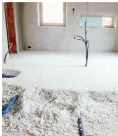
Směs je nutné poté zarovnat do požadované výšky pomocí srovnávací latě a poté jemně ztuhnět.