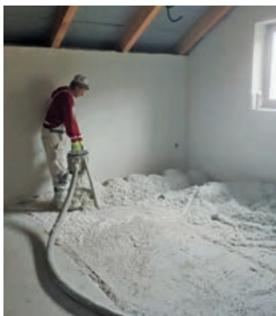
Izolační směs ThermoWhite je na realizovanou plochu vháněna z míchacího přístroje pomocí hadic.