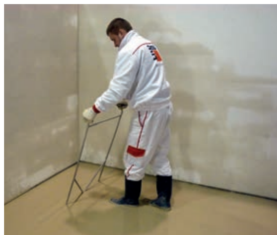
Odvzdušnění litého potěru vibrační latí.