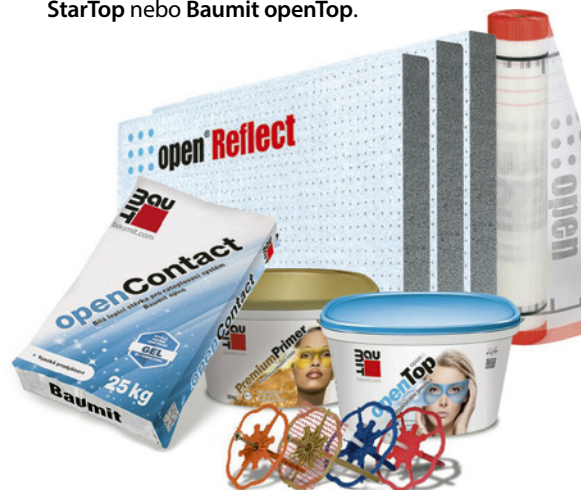
Baumit open – sestava výrobků zateplovacího systému

Baumit open je také vysoce kvalitní lepicí hmota Baumit openContact , která až sedminásobně překračuje požadované hodnoty přídržnosti k výše zmíněným podkladům, dále sklotextilní výztužná síťovina Baumit openTex se zvýšenou pevností a funkcí základního penetračního nátěru plní výrobek Baumit PremiumPrimer se zvýšenou kryvostí, který vyniká vysokou přídržností k podkladu. Pro investory se specifickými požadavky na finální fasádu lze doporučit omítku Baumit CreativTop , umožňující na fasádě aplikaci rozmanitých kreativních technik a prémiové fasádní omítky Baumit StarTop nebo Baumit openTop .