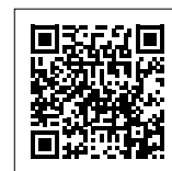
Video k aplikaci zateplovacího systému Baumit open