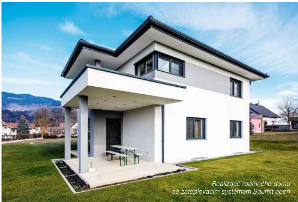
Realizace rodinného domu se zateplovacím systémem Baumit open