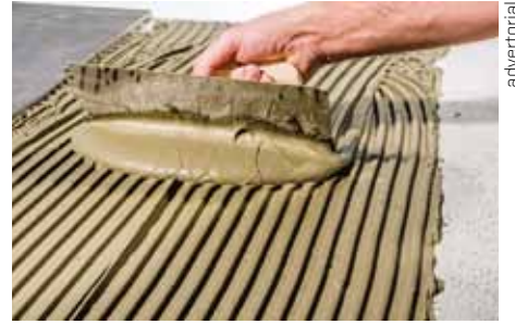
Baumit Baumacol FlexUni Gel – nová lepicí hmota nabízí snadnou zpracovatelnost

Poslední novinkou z portfolia uceleného programu na lepení obkladů a dlažeb je nová spárovací hmota Baumit Baumacol XL Fuge na širší spáry, nabízená na trhu v 5kg balení. Dosavadní úspěšná produktová řada Baumit Baumacol Premium Fuge nabízí použití spárovací hmoty pouze pro spáry o šířce od 1 do 8 mm. Právě toto částečné omezení je řešeno novým výrobkem s označením Baumit Baumacol XL Fuge, který umožňuje plošné spárování kamenných a keramických obkladových prvků se šířkou spáry v rozpětí 3–15 mm.