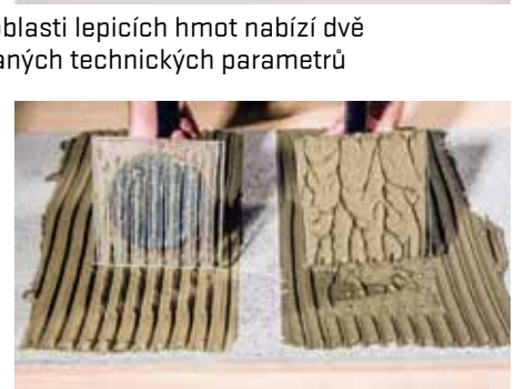
Baumit Baumacol FlexUni Gel – plocha slepu (vpravo) je téměř sto procentní

Základním složením se jedná o flexibilní mrazuvzdornou spárovací hmotu se sníženou nasákavostí vodou a vysokou oteřuvzdorností, určenou pro interiéry i exteriéry. Díky obsahu trasových složek hmota také vykazuje zvýšenou odolnost proti vápenným výkvětům, což ocení uživatel zejména při spárování kamenných či betonových prvků. Její aplikace se doporučuje také v místech se zvýšeným namáháním, například na terasách, balkonech nebo plochách s podlahovým vytápěním. Zajímavostí u této spárovací hmoty je její dostupnost v šesti nejžádanějších barevných odstínech.