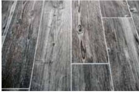
Novinka Baumit Baumacol XL Fuge je spárovací hmotou nabízenou v šesti nejžádanějších barevných odstínech

Patří sem například obklady bazénu, lepení velkoformátových obkladů či dlažby nebo tenkých obkladových prvků. Aplikovat se dá i v případě pokládky dlažby na podlahové topení. Stejně jako