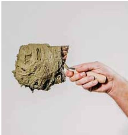
Baumit Baumacol FlexUni Gel – novinka v oblasti lepicích hmot nabízí dvě konzistence použití při zachování deklarovaných technických parametrů