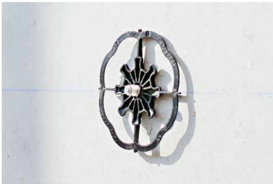
Lepicí kotva – detail