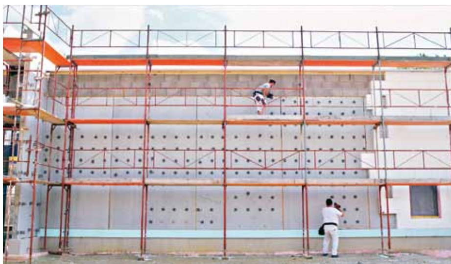
Kotvení izolačních desek