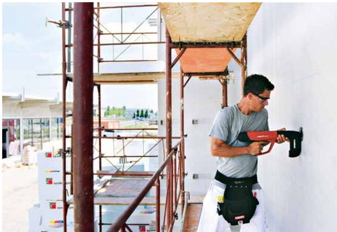
Instalace lepicí kotvy

O prokazatelných energetických výhodách zateplení stavebního objektu již dnes není sporu. Za uplynulých několik desítek let prošly zateplovací systémy ETICS mnoha změnami z hlediska materiálů i technologického postupu. Novinka roku 2021 Baumit StarTrack X1 představuje revoluční přístup v lepeném kotvení izolačních desek.