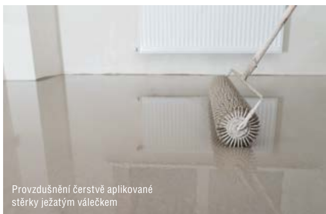
Provzdušnění čerstvě aplikované stěrky ježatým válečkem