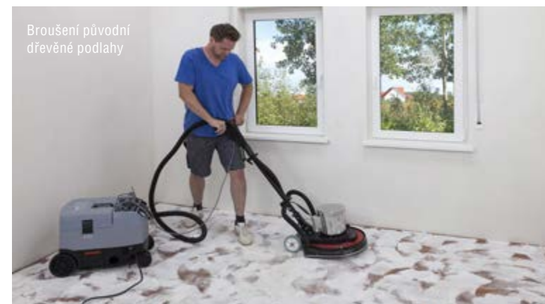
Broušení původní dřevěné podlahy