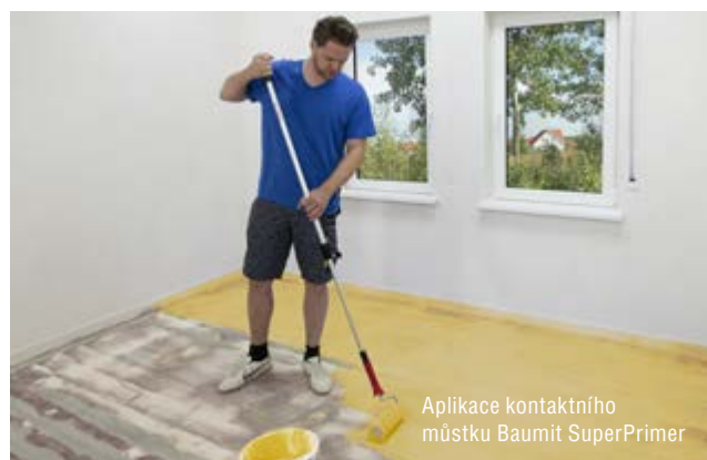
Aplikace kontaktního můstku Baunit SuperPrimer

těchto stěrtek patří především dosažení dokonalé rovinnosti, a to již u minimální tloušťky vrstvy. U některých typů nášlapných vrstev, jakými jsou například velkoformátové dlažby či přesné povrchy typu PVC a vinylových podlah, je použití samonivelačních stěrtek v podstatě předepsáno. Důvodem je jejich vynikající rovinnost a rovněž také objemová stálost. Prémiovým produktem v této řadě je Baunit Nivello Quattro vyráběný na bázi síranu vápenatého v kombinaci s dalšími pojivy, přísadami a pískem. Používá se k vyrovnání všech druhů cementových a litých potěrů v rozmezí tloušťky vrstvy již od 1 mm až do 25 mm. Už zmíněné vlastnosti doplňuje tento výrobek o bezpórovitý povrch a též o velmi dobrou tepelnou vodivost, proto jej lze použít u elektrického podlahového topení s odporovým drátem vloženým přímo do vrstvy stěrky. V případě teplovodního vytápění podlahy je vhodné samonivelační stěrku Baunit Nivello Quattro použít v kombinaci se systémem REHAU RATHERM SPEED. V obou případech je tloušťka samonivelační stěrky nad otopným systémem minimálně 8 mm, resp. 10 mm. Díky tomu se tyto podlahové skladby hodí obzvláště pro rekonstrukce. Baunit Nivello Quattro se uplatní též u dřevostaveb, kde je podlahový systém tvořen sádrovláknitými deskami Fermacell.