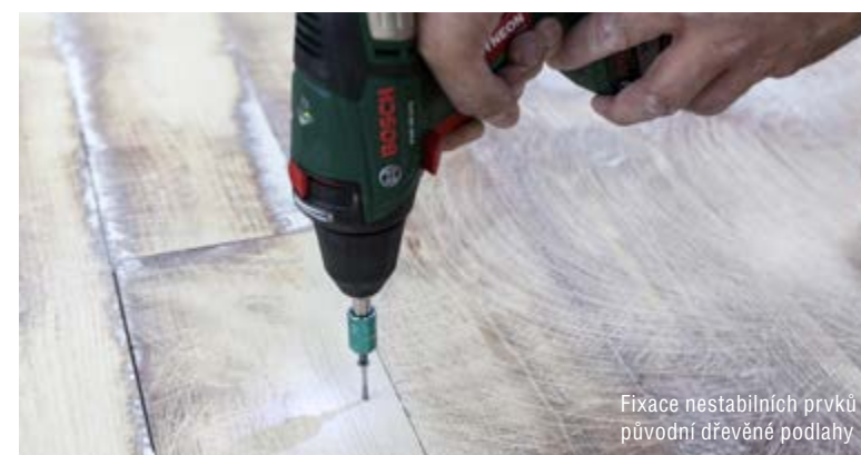
Fixace nestabilních prvků původní dřevěné podlahy

kteří jsou vhodné pro vyšší zatížení jako plovoucí, oddělený nebo spojený potěr. Uplatnění naleznou především u větších podlahových výměřů a mezi jejich přednosti patří rozličné vlastnosti, objemová stálost a bezproblémové strojové zpracování. Baumit je v této oblasti reprezentován řadou samonivelačních litých potěrů Baumit Alpha. Třetím možným řešením jsou cementové potěry. Ty vynikají vysokou pevností v tlaku i pevností v tahu za ohybu. Svým složením se hodí mimo jiné do exteriéru a interiéru v místech s vyšší vlhkostí. Další předností cementových potěrů je snadná zpracovatelnost a také poměr ceny a výkonu. V této skupině uvedme jako zástupce produkty Baumit Betonový potěr a Baumit FlexBeton a další typy těchto potěrů.