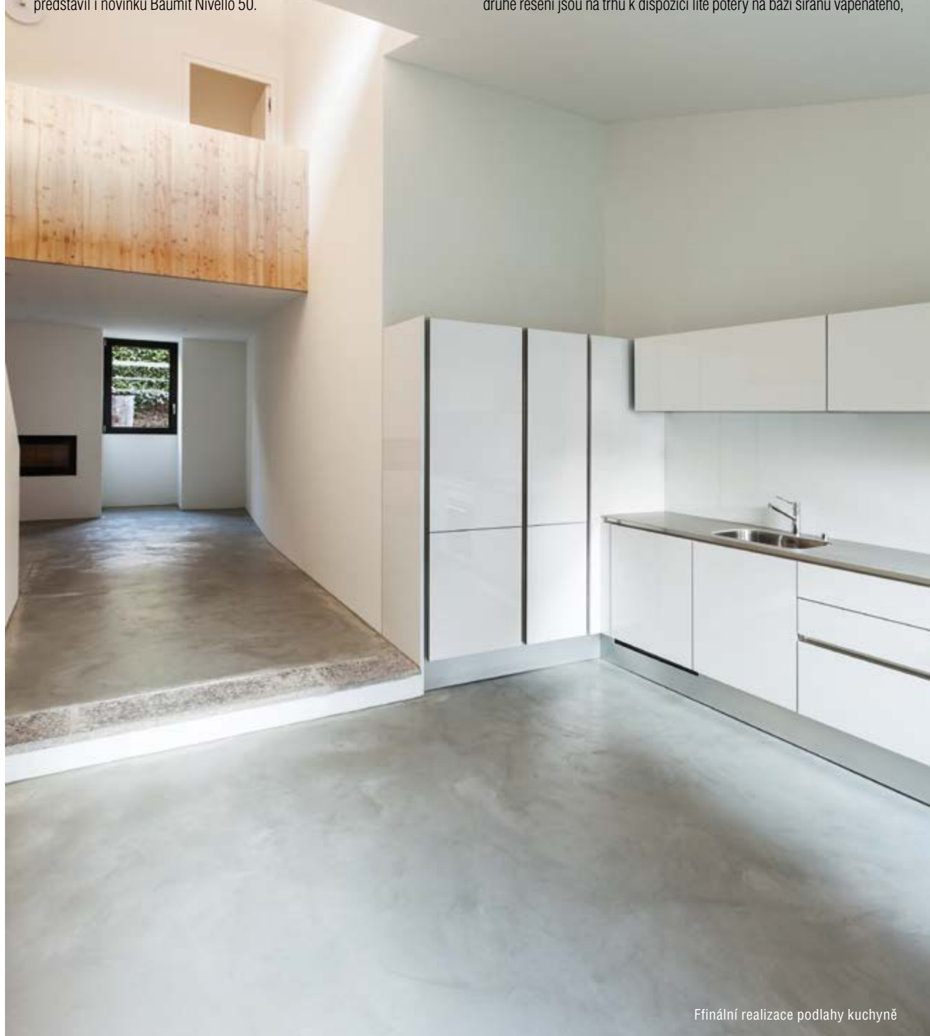
Finální realizace podlahy kuchyně

Na úvod si pro úplnost vyjasněme, že použití samonivelačních stěrek řady Baumit Nivello je jednou ze tří možností, jak vyřešit podkladní vrstvu podlahové konstrukce před pokládkou finální nášlapné vrstvy. Jako druhé řešení jsou na trhu k dispozici lité potěry na bázi síranu vápenatého,