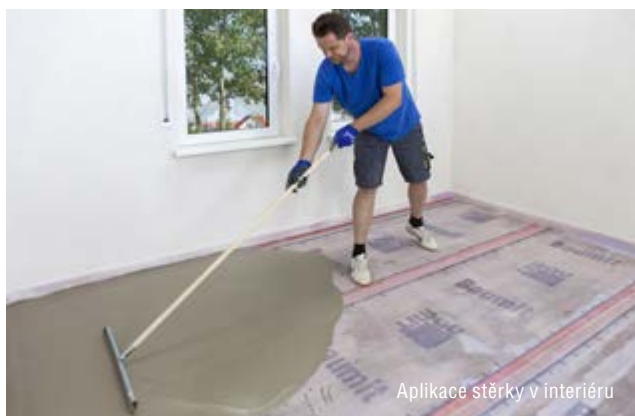
Aplikace stěrky v interiéru