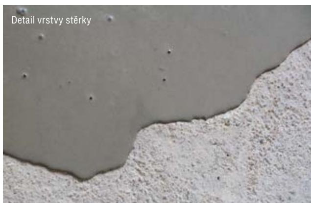
Detail vrstvy stěrky