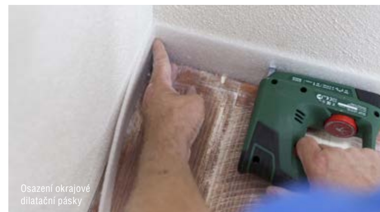
Osazení okrajové dilatační pásy