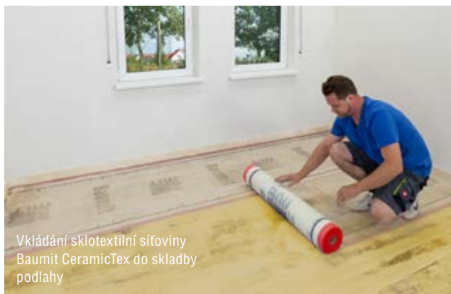
Vkládání sklotextilní síťoviny Baunit CeramicTex do skladby podlahy