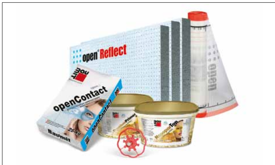
ETICS Baumit open – Sestava zatepovacího systému