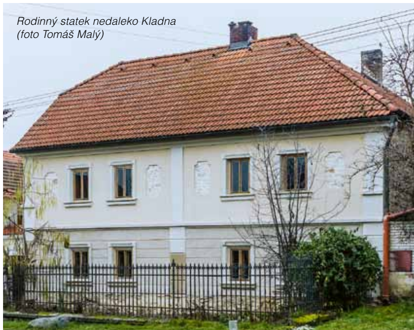
Rodinný statek nedaleko Kladna

Rozsáhlou obnovou s použitím výrobků Baumit prošel také rodinný statek v obci nedaleko Kladna. „Vzhledem k tomu, že některé části tohoto objektu se datují přibližně k roku 1720, chtěl jsem použít tradiční materiály. Zjistil jsem, že Baumit nabízí ucelenou řadu těchto velmi kvalitních produktů, a proto jsme při renovaci využili jak jádrové omítky a štuky, tak i fasádní barvu. Výsledkem správné aplikace výrobků Baumit NHL je krásný povrch odpovídající původní fasádě statku,“ pochvaluje si majitel této rodinné usedlosti.