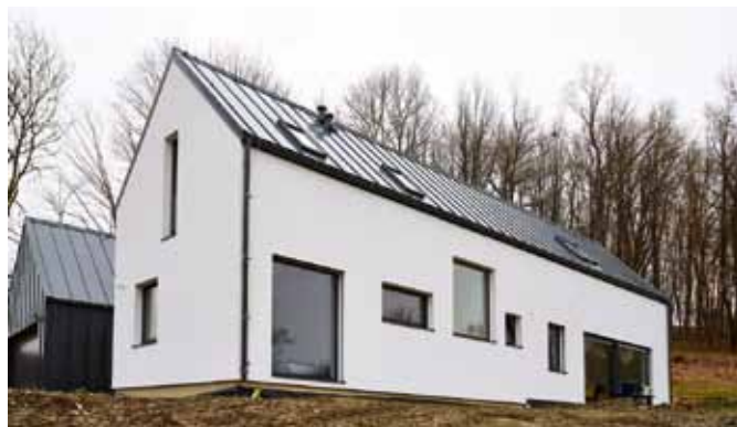
Rodinný dům, Pulečň. Zateplovací systém Baumit. Povrchová úprava Baumit NanoporTop

K probarvování prémiových omítek jsou používány nové druhy tzv. cool pigmentů, které eliminují letitý problém tmavých fasád, kterým je jejich přehřívání při oslunění. Typickým příkladem je náhrada běžné železité černi speciálními tepelně odrazivými pigmenty, např. směsným oxidem železito-chromitým nebo černým nikelnatým spinelem. Tyto pigmenty absorbují viditelné světlo, ale krátkovlnné infračervené záření odrážejí. Při jejich použití si proto fasáda vystavená slunečnímu svitu uchovává nižší teplotu než fasáda probarvená běžnými pigmenty. Tím se omezí její teplotní dilatace a degradace a fasáda se následně tolik nepřehřívá. Díky prémiové omítce Baumit PuraTop se podařilo spojit barevné a estetické představy architekta s energetickou šetrností a dlouhodobou trvanlivostí fasády. Tato omítka umožňuje prakticky nekonečný výběr libovolných odstínů, včetně 94 nejintenzivnějších odstínů barev ze vzorníku Baumit Life. Díky svým výrazně sytým a jasným barvám dodává každé fasádě výjimečný a velmi individuální charakter.