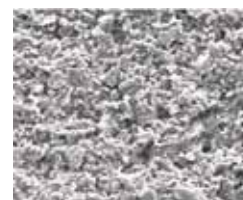
Povrch tradiční omítky je výrazně hrubší. Špína na něm ulpí snadněji