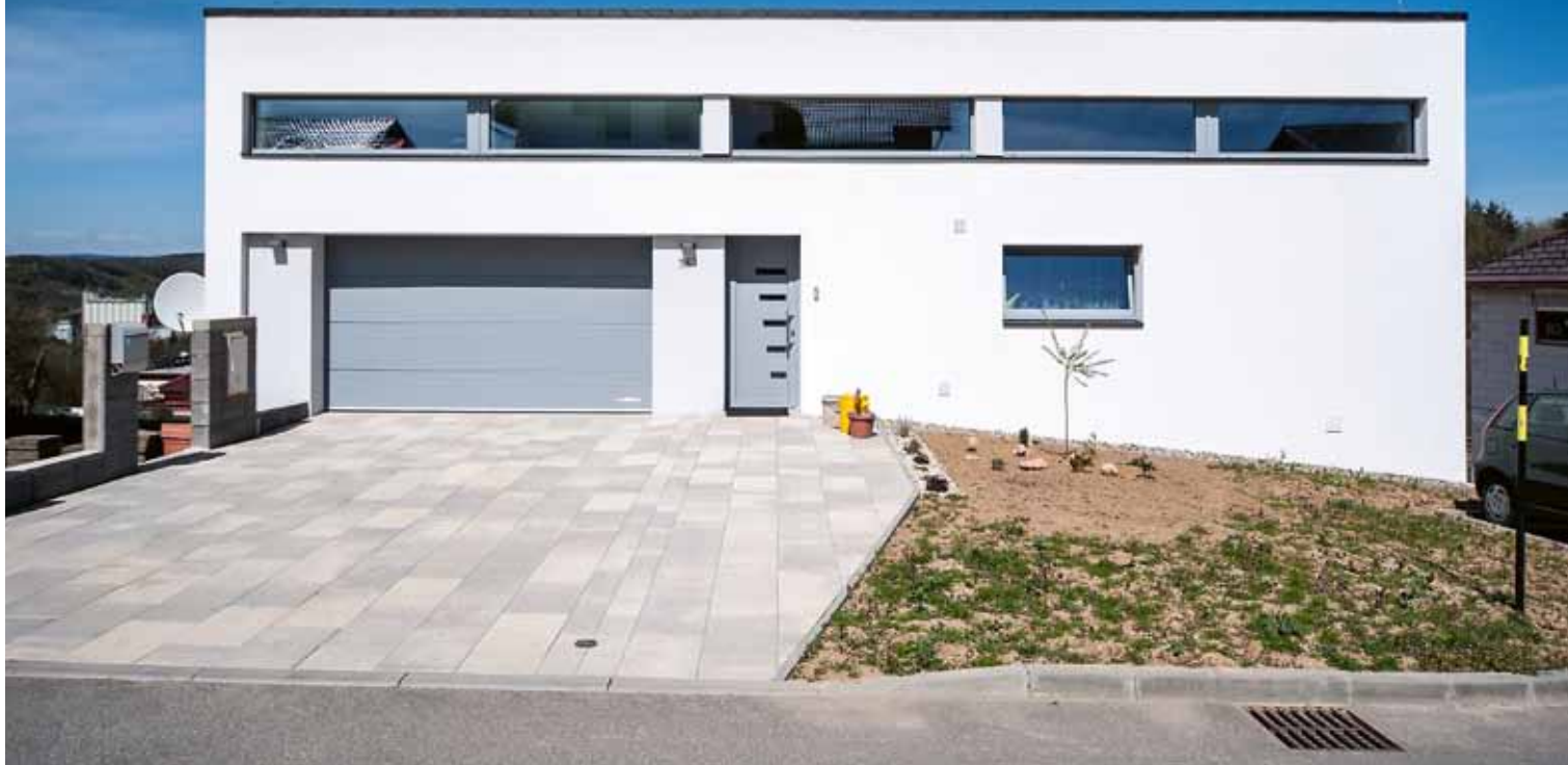
Rodinný dům, Lípa nad Dřevnicí. Zateplovací systém Baumit, omítka Baumit NanoporTop

S vnímáním vývoje a dělení fasádních omítek je to podobné jako s automobily. Vedle mainstreamových produktů přicházejí výrobci na trh s prémiovými výrobky a značkami, které svými mimořádnými vlastnostmi přímo vystupují z davu. Výrobce stavebních materiálů Baumit není výjimkou a na trhu s prémiovými omítkami nabízí, stejně jako v jiných případech, systémová řešení na míru.