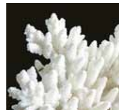
Povrch omítky Baumit StarTop připomíná strukturu korálu