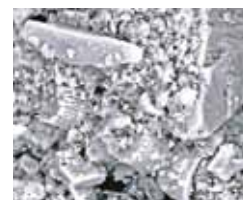
Mikroskopicky přiblížený snímek povrchu s omítkou Baumit StarTop ukazuje, jak se na něm šíří voda a jak díky tomu rychle schne