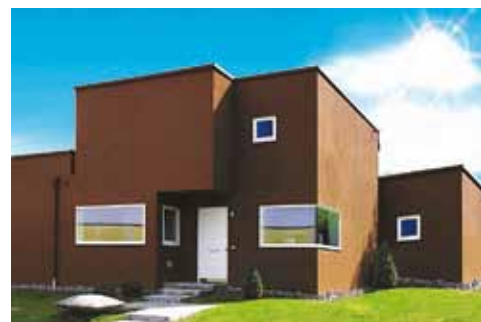
Cool pigmenty snižují povrchovou teplotu tmavých a výrazných odstínů na fasádě

vývojem spirálou vrací zpět k pojivům, která vždy vykazovala tu nejlepší povětrnostní stabilitu a nejnižší sklon ke žloutnutí, tedy k plně akrylátovým disperzím. Cenová hladina prémiových výrobků to zkrátka umožnila. Mezi výhody prémiových omítek Baumit patří také jejich nabídka v jemné struktuře K1 se zrnitostí 1 mm pro dosažení velmi hladkých povrchů fasád.